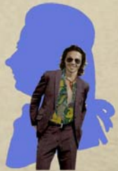
Guglielmo , ufficiale, amante di Fiordiligi (Baritono);