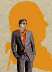
Ferrando , ufficiale, amante di Dorabella (Tenore);