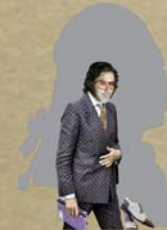
Don Alfonso , vecchio filosofo (Basso);