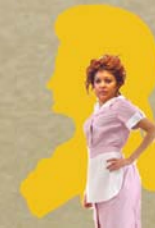
Despina , cameriera (Soprano);