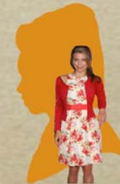
Dorabella , dama ferrarese e sorella di Fiordiligi (Mezzo soprano);