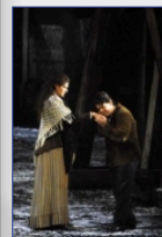
Opern / Ballett- live Digitales Bild