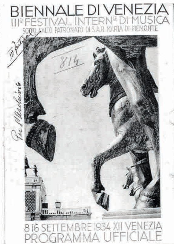
Frontespizio del programma ufficiale del terzo Festival internazionale di musica della Biennale di Venezia, che si svolse dall'8 al 16 settembre 1934.

Assumono invece il sapore della retrospettiva (Krenek era mancato quattro anni prima, nel 1991) i due concerti del 28 maggio 1994 nell'ambito del progetto «Sonopolis», a Mestre, con la Sonatina per flauto e clarinetto, e quello del 22 aprile 2002, affidato alla magistrale interpretazione dell'Ex Novo Ensemble, della giovanile Serenade per clarinetto, violino, viola e violoncello.