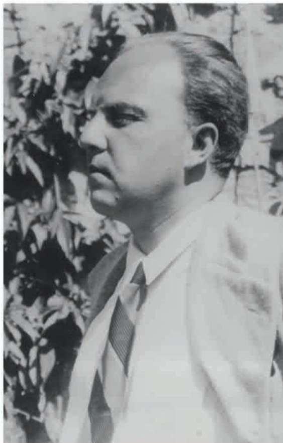
Ernst Krenek. Ernst Krenek Institut Privatstiftung.

e Stravinskij, richiama atmosfere romantiche del passato, presenta nostalgie neoclassiche o si slancia coraggiosamente alla ricerca di nuove forme e grammatiche. La serialità resta comunque centrale per grande parte della sua parabola artistica, e viene 'superata' soltanto nel maturo periodo americano, in vista di approcci più liberi e innovativi.