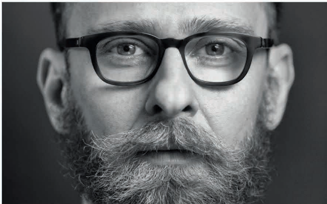
Valentino Villa.

gelosia. In realtà il mito di Cefalo e Procri, soprattutto nel Cinque Seicento, è stato molto sfruttato per parlare di fedeltà e infedeltà coniugale. Molte delle raffigurazioni che possediamo provengono da stanze di sposi che avrebbero dovuto riferirsi a quell'immaginario come monito. Quindi l'operazione che realizzano Krenek e Küfferle è paradossalmente filologica rispetto all'utilizzo di questo mito nella storia.