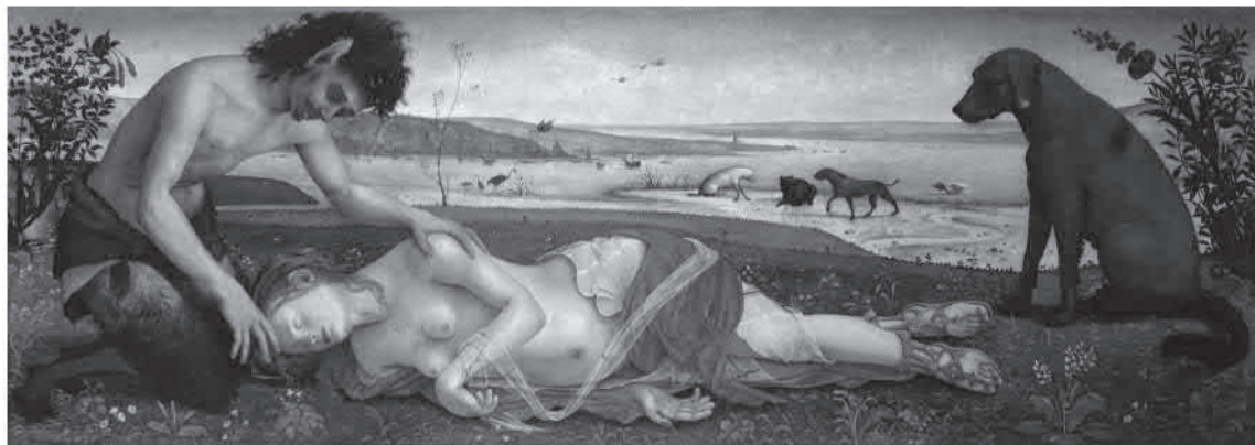
Piero di Cosimo (Firenze, 1461 circa - 1522), Morte di Procri . Olio su legno di pioppo, 1495 circa. Londra, National Gallery.

marital fidelity and infidelity. Many of the portrayals we see come from rooms with marital couples that were meant to be taken as an admonition. So the operation that Krenek and Küfferle have carried out is paradoxically philological as regards the use of this myth in the story.