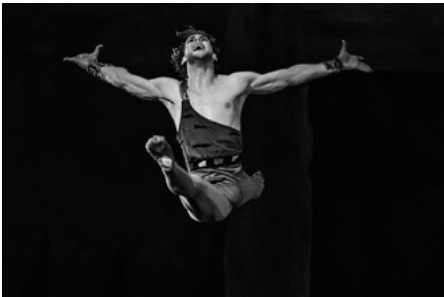
Vladimir Shklyarov.