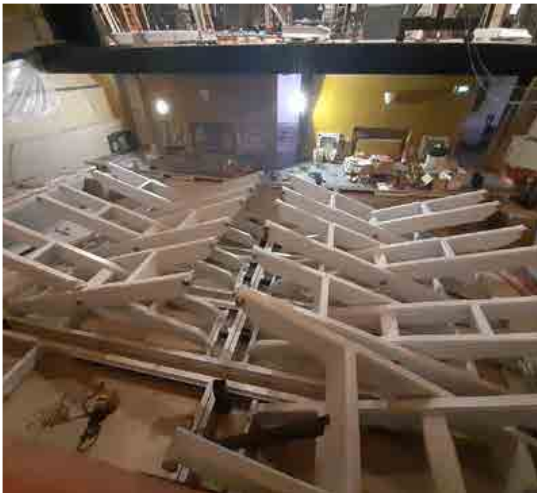
Il palcoscenico del Teatro Malibran, durante i lavori di riqualificazione, 2020.

vuota e buia che distanziava, durante i concerti, i musicisti dagli spettatori. Da tempo pensavamo bisognasse colmare quella lacuna, e ora siamo riusciti a concludere il lavoro: la fossa del teatro si è dotata di una struttura elettromeccanica, e dividendo il pavimento in quattro sezioni permette di muoverla ad altezze differenti e di portarla fino al palcoscenico. Questo ci consentirà di moltiplicare le attività del Malibran, soprattutto per quanto riguarda il repertorio barocco, che da tempo abbiamo scelto come una delle linee guida della nostra programmazione, insieme ovviamente al melodramma e alle produzioni contemporanee, e che potrà essere vissuto dal pubblico con una vicinanza e un'emozione molto maggiori.