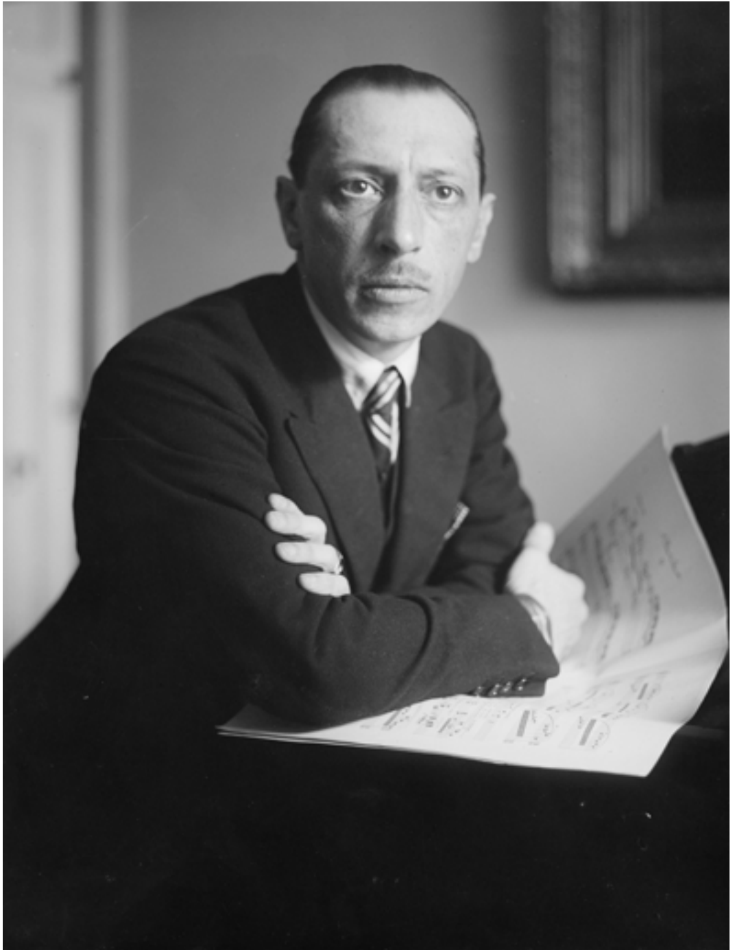
Igor Stravinskij negli anni Trenta.