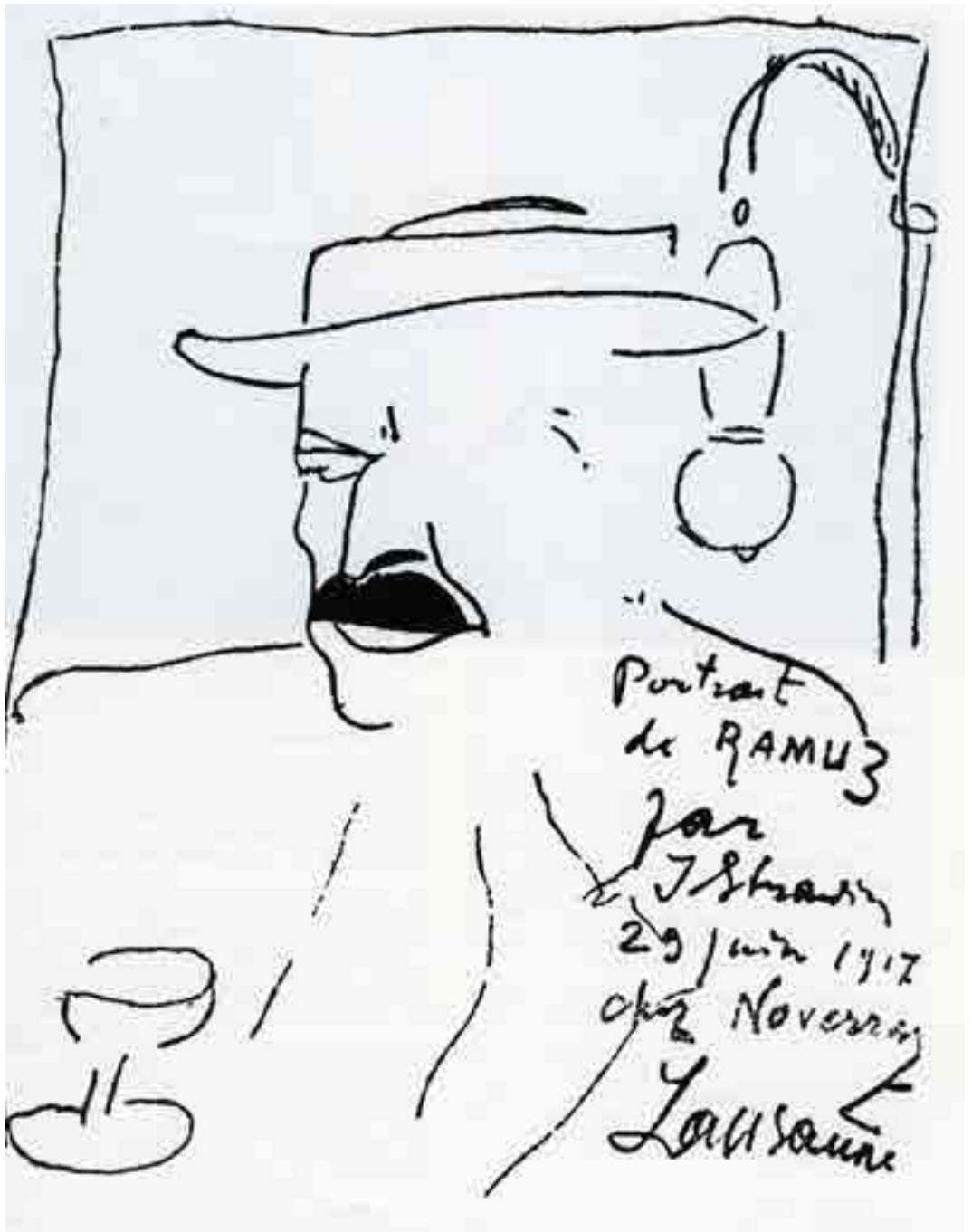
Charles-Ferdinand Ramuz (1878-1947), librettista di Histoire du soldat , in un disegno di Stravinskij, Losanna 1917.