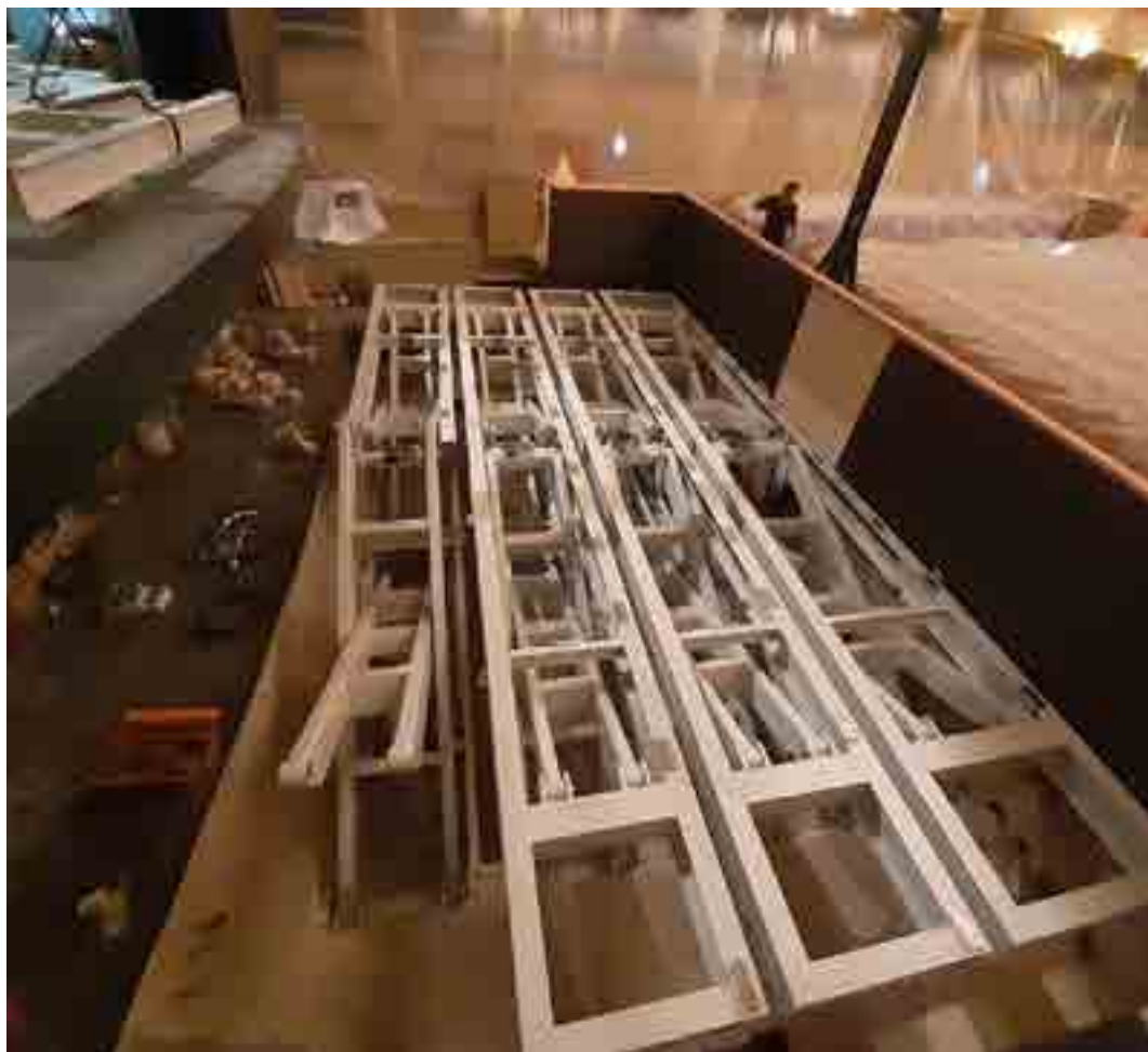
Il palcoscenico del Teatro Malibrán, durante i lavori di riqualificazione, 2020.