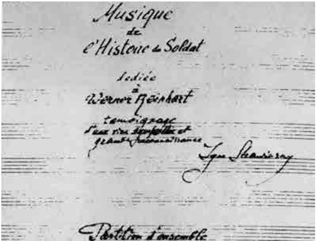
Frontespizio autografo dell' Histoire du soldat di Igor Stravinskij.

Jean Cocteau. L'esteta francese, che aveva preso le distanze dal Sacre du printemps e da una tendenza stravinskijana al misticismo tentacolare wagneriano, in Histoire ritrova le tracce di quella che definisce una nuova semplicità, soffermandosi forse un po' troppo alla superficie del lavoro, al suo sapore di teatrino ambulante condito con musiche di consumo. Chi invece non gradì affatto questo nuovo minimalismo stravinskijano fu Diaghilev. Il geniale impresario dei Balletti Russi non aveva gradito questo primo atto d'emancipazione. Lo racconta lo stesso Stravinskij nelle Cronache . «Quando lo vidi a Parigi, gli parlai naturalmente del Soldat e della gioia che mi aveva procurato il suo successo. Ma Diaghilev non mostrò a questo proposito alcun entusiasmo. La cosa non mi sorprese affatto. Conoscevo troppo bene il suo carattere. Era di una gelosia incredibile nei confronti dei propri amici e collaboratori, quelli soprattutto ai quali teneva maggiormente. Non voleva saperne di riconoscere loro il diritto di lavorare indipendentemente da lui e dalla sua impresa. Considerava tale cosa un tradimento». L' Histoire provocò anni di freddezza tra i due che tuttavia vennero superati dalla collaborazione per Pulcinella (1920) e Les Noces (1923). Oggi il geniale esteta impresario (che morì nel 1929) e il compositore errante (che terminò la vita a New York nel 1971) giacciono entrambi in laguna, sull'isola di San Michele, in due tombe vicine, per espressa volontà.