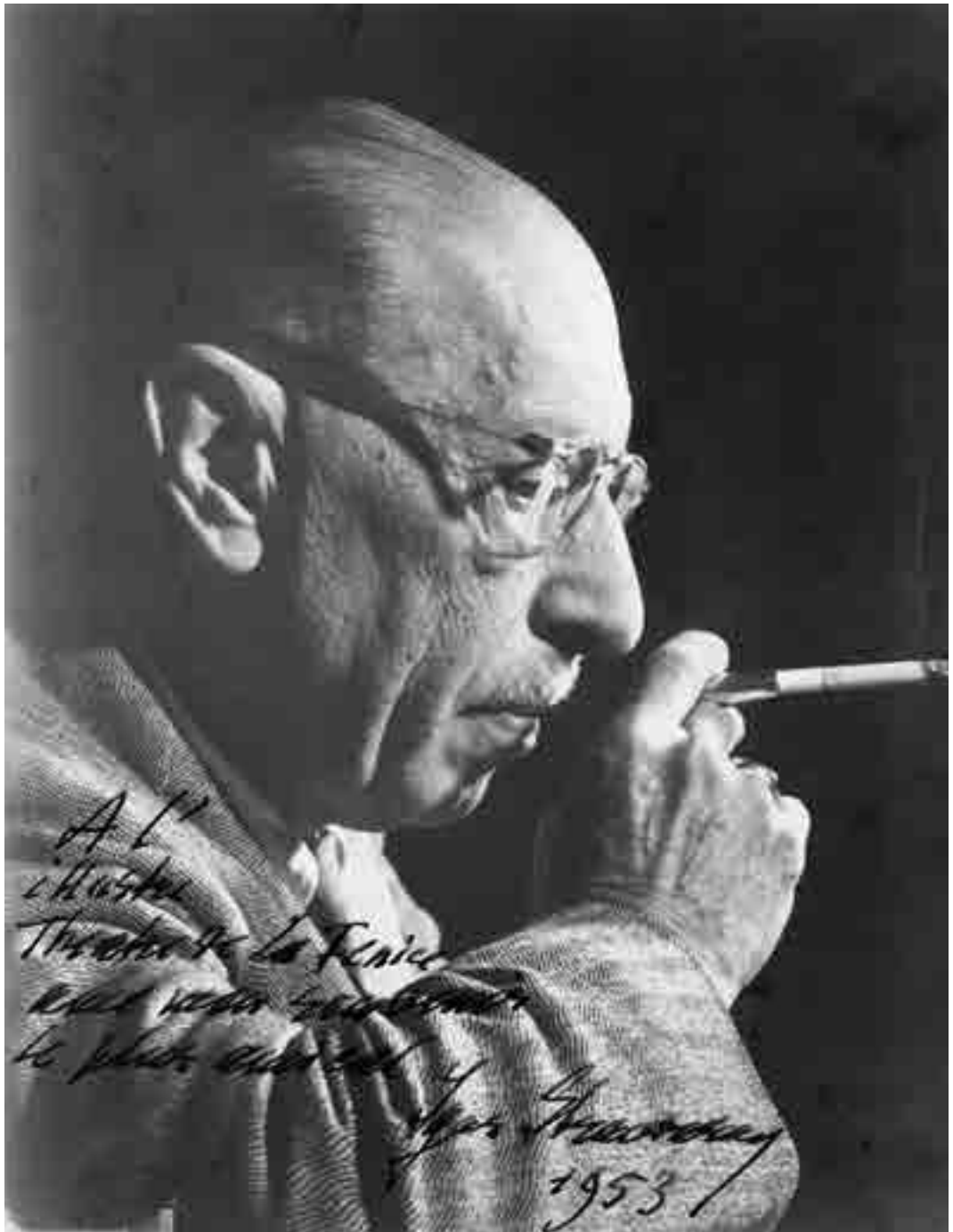
Igor Stravinskij (1882-1971), in una foto con dedica al Teatro La Fenice, 1953.