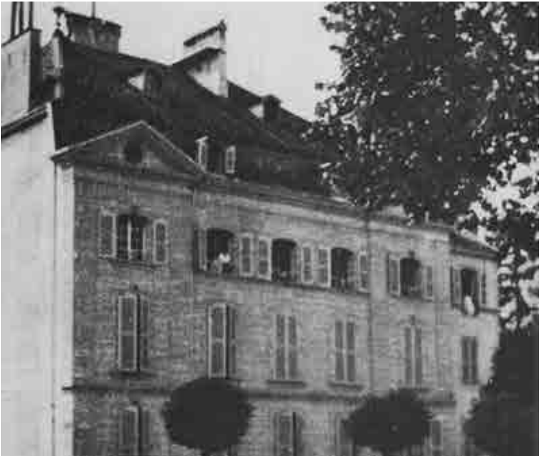
La Maison Bornand di Morges, in Svizzera, dove furono composte l'Histoire du soldat e Pulcinella, offrì rifugio agli Stravinskij dal 1917 al 1920.

per esempio, richieda pochi strumenti, e i personaggi si riducano a due o tre? (il calcolo si rivelerà completamente falso). Visto che non ci sono più teatri, avremo un teatro nostro, in altre parole allestimenti nostri che si possono montare senza fatica in qualsiasi locale e persino all'aperto; riporteremo in vita la tradizione dei teatri ambulanti, da fiera... Potremo sfruttare così i pubblici d'ogni fatta, senza troppe spese... L'Histoire du soldat è nata da queste considerazioni pratiche o che avrebbero dovuto esserlo – ma che lo erano poco. Doveva essere un affare, e un buon affare: non è mai stata un buon affare e neppure un affare senza aggettivi [...] Ahinoi scritta la pièce (parole e musica), e scritta velocemente, abbiamo scoperto che gli ostacoli stavano solo cominciando. L'Histoire du soldat esisteva sì (sulla carta), ma ora doveva venir rappresentata perché era fatta per la rappresentazione [...]. Scopriamo troppo tardi che la via più pratica sarebbe stata quella di procedere all'interno di un genere consacrato, seguendo cioè le abitudini del pubblico e di quanti fanno il mestiere di divertirlo; scoprimmo insomma che innovare, anche semplificando, significava complicare tutto».