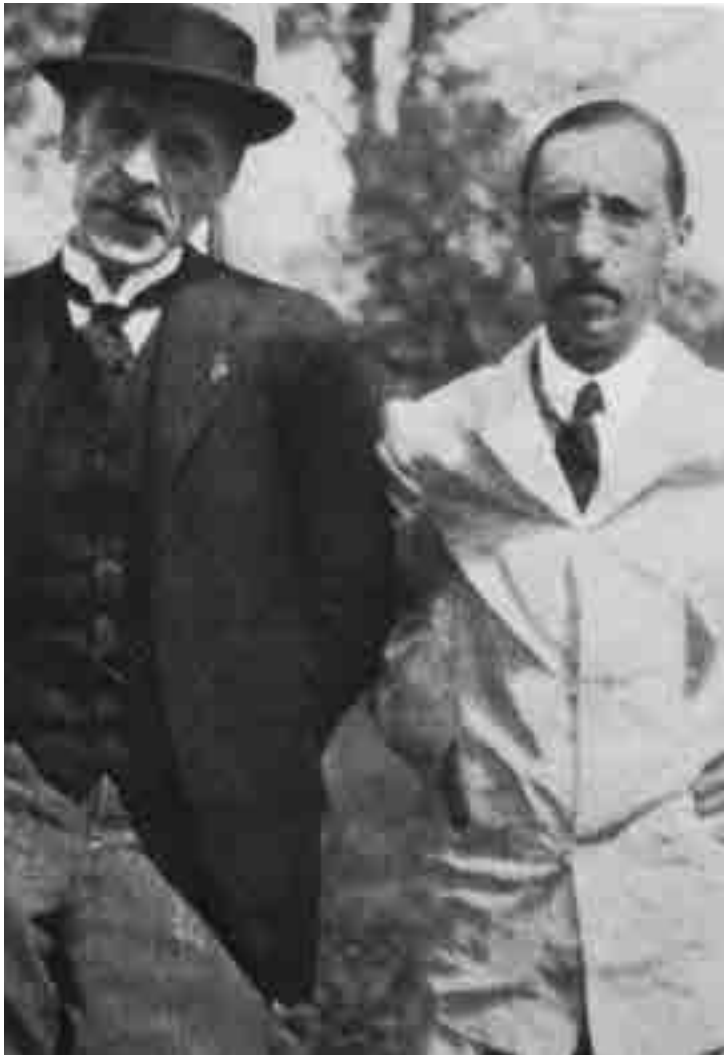
Charles-Ferdinand Ramuz e Igor Stravinskij a Morges, Canton Vaud in Svizzera, nel 1915.

tardi, nel 1924, grazie all'editore e mecenate Grasset). La proposta di un incontro con Stravinskij gli arriva dal direttore d'orchestra Ernest Ansermet e l'idea è anche quella di studiare una possibile collaborazione. Tuttavia, nei Souvenirs sur Igor Stravinskij lo scrittore confessa con onestà che di Stravinskij ignorava tutto, tranne il fatto che fosse russo e avesse scritto un balletto che incominciava a essere famoso. Ramuz e il compositore iniziarono in maniera molto cordiale, tra pane e vino, nei caveaux del Vaud, la loro amicizia. Lunghe passeggiate in cui Stravinskij parlava al romanziere della Russia, dei suoi piani di viaggio per ritornare in patria e delle grandi speranze sul futuro della grande Russia di tutti i russi che la pace di