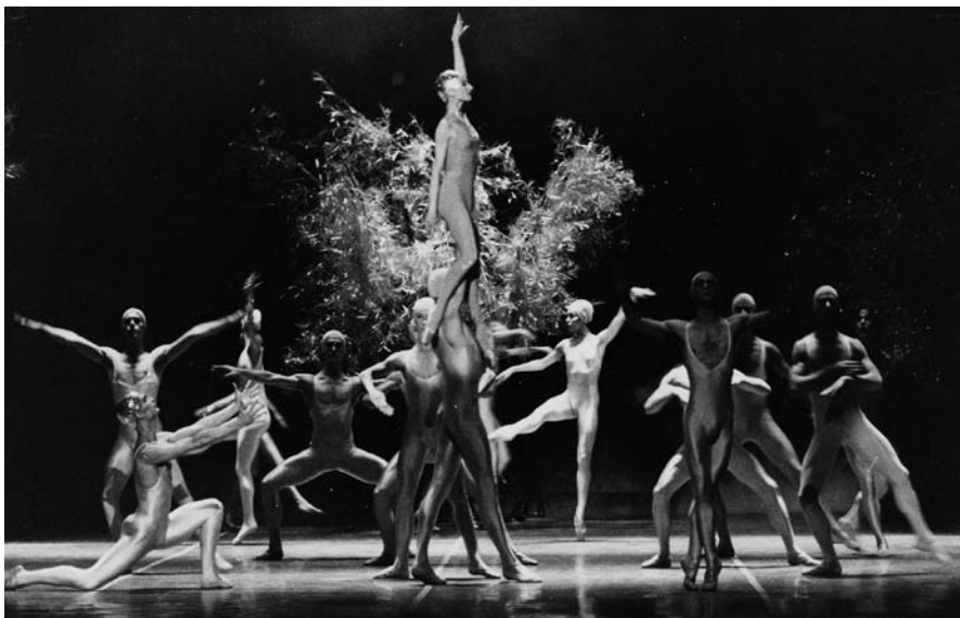
Foto di scena di Sogno di una notte di mezza estate, coreografia e regia di John Neumeier, musiche di Felix Mendelssohn Bartholdy e György Ligeti, scene e costumi di Jurgen Rose; Ballett der Hamburgischen Staatsoper. Venezia, Teatro La Fenice, 1983.