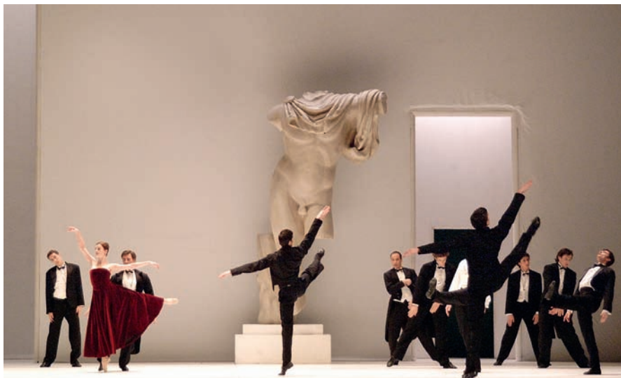
Foto di scena di Sylvia , coreografia di John Neumeier, musica di Léo Delibes, scene e costumi di Yannis Kokkos; Ballet de l'Opéra National de Paris. Venezia, Teatro La Fenice, 2005.