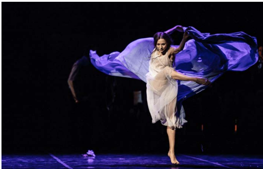
Foto di scena di Duse, coreografia, costumi e luci di John Neumeier, musiche di Benjamin Britten, Arvo Pärt; Hamburg Ballet John Neumeier. Venezia, Teatro La Fenice, 2020.