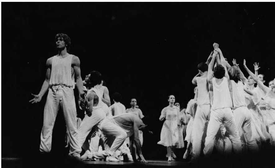
Foto di scena della Passione secondo Matteo, coreografia, regia, scene e costumi di John Neumeier, musica di Johann Sebastian Bach; Ballett der Hamburgischen Staatsoper. Venezia, Basilica dei SS. Giovanni e Paolo, 1983.