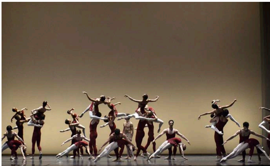
Foto di scena della Terza Sinfonia di Gustav Mahler, coreografia, costumi e luci di John Neumeier, musica di Gustav Mahler; Hamburg Ballet John Neumeier. Venezia, Teatro La Fenice, 2015.